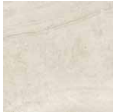
60x60 cm - 23 5/8" x 23 5/8" *