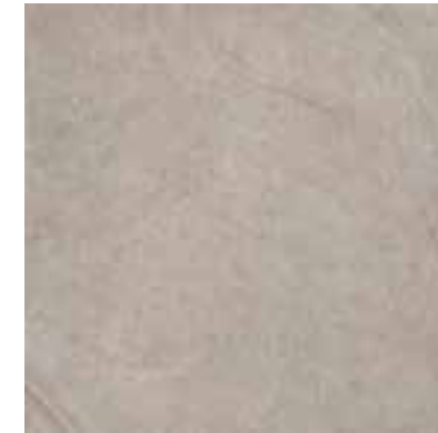
60x60 cm - 23 5/8" x 23 5/8" *