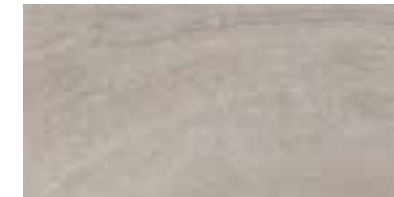
30x60 cm - 11 13/16" x 23 5/8"