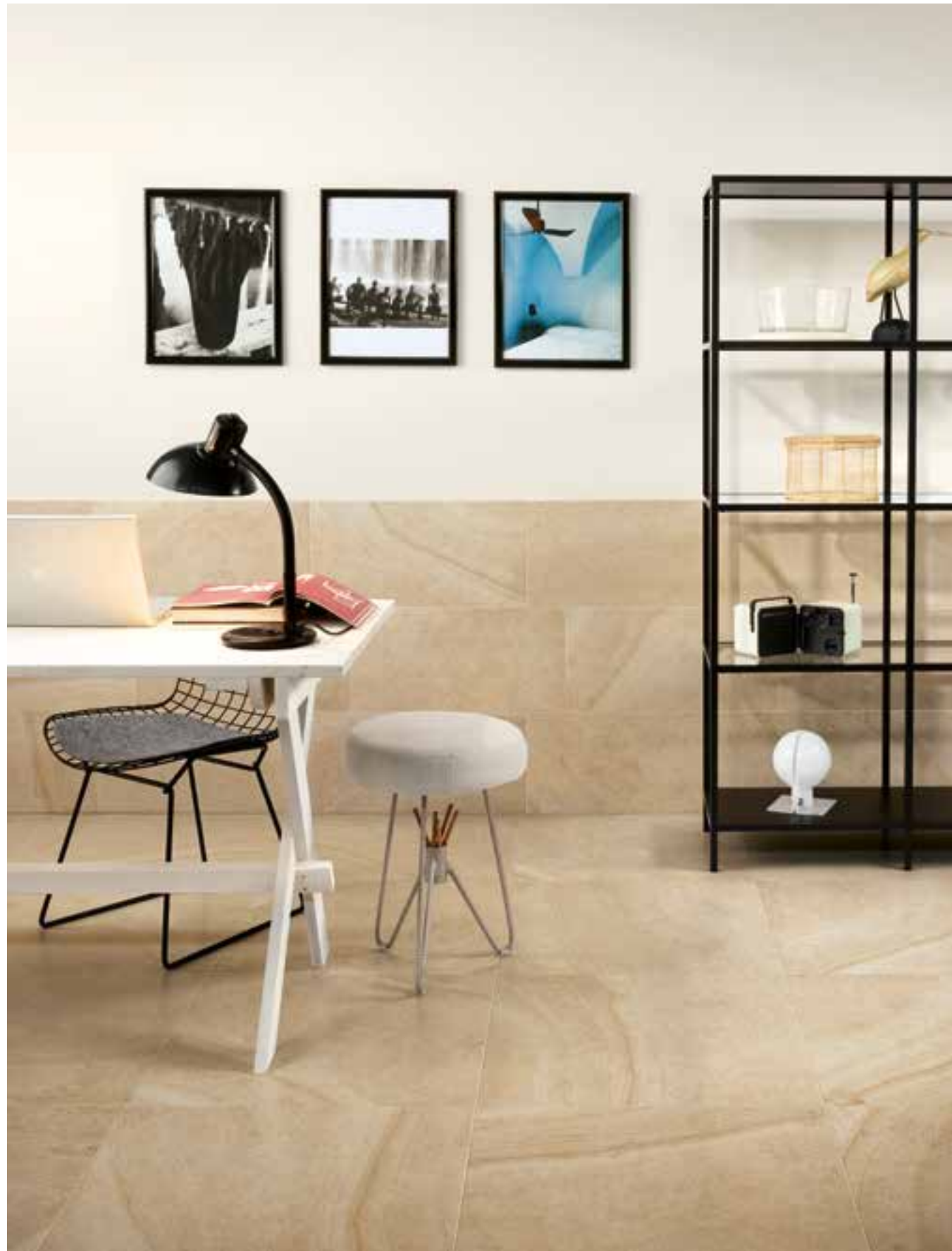
Maison Creme 60x60 cm - 30x60 cm