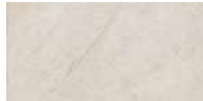
30x60 cm - 11 13/16" x 23 5/8"