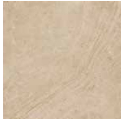
60x60 cm - 23 5/8" x 23 5/8" *