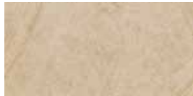
30x60 cm - 11 13/16" x 23 5/8"