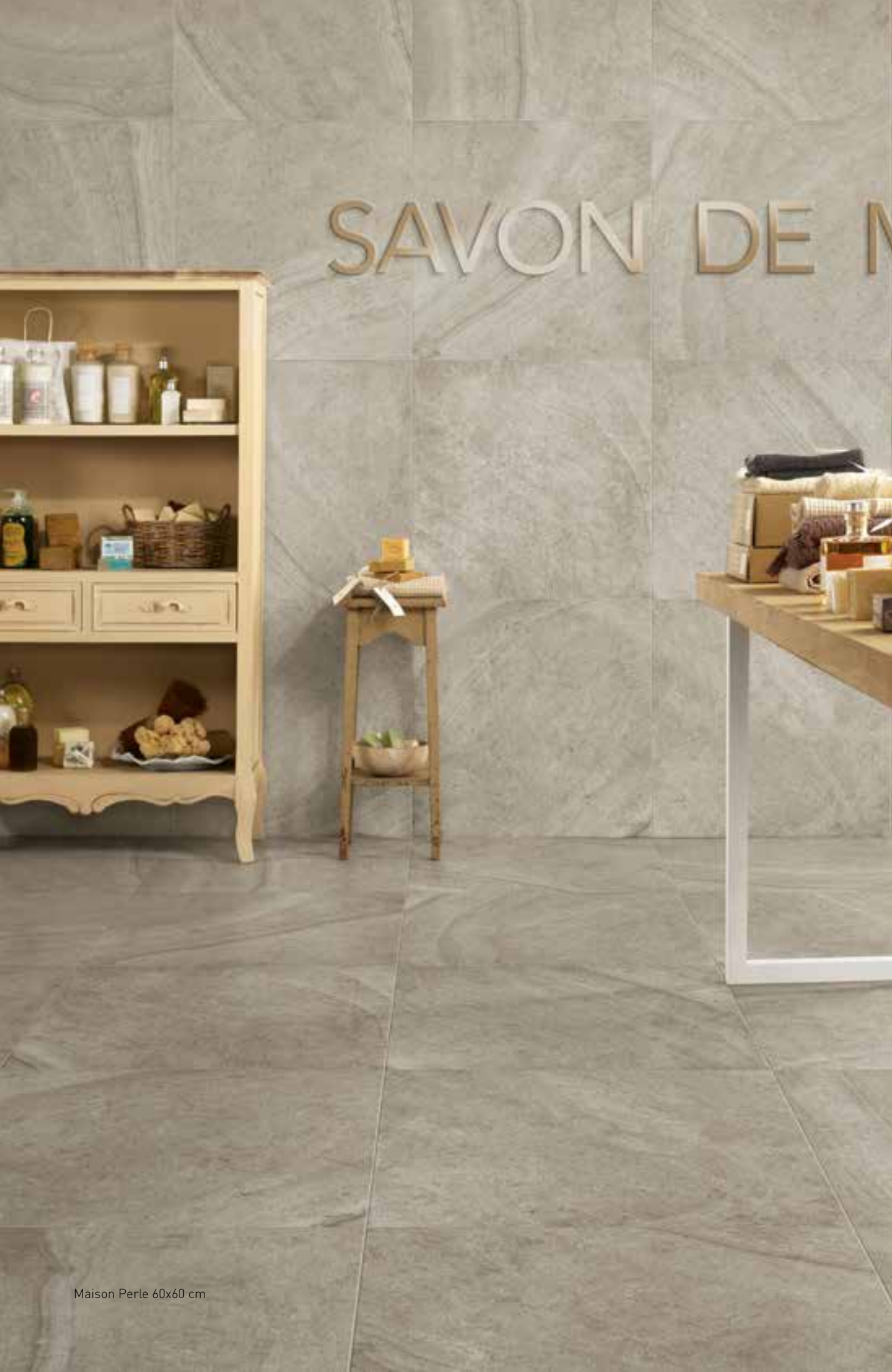
Maison Perle 60x60 cm