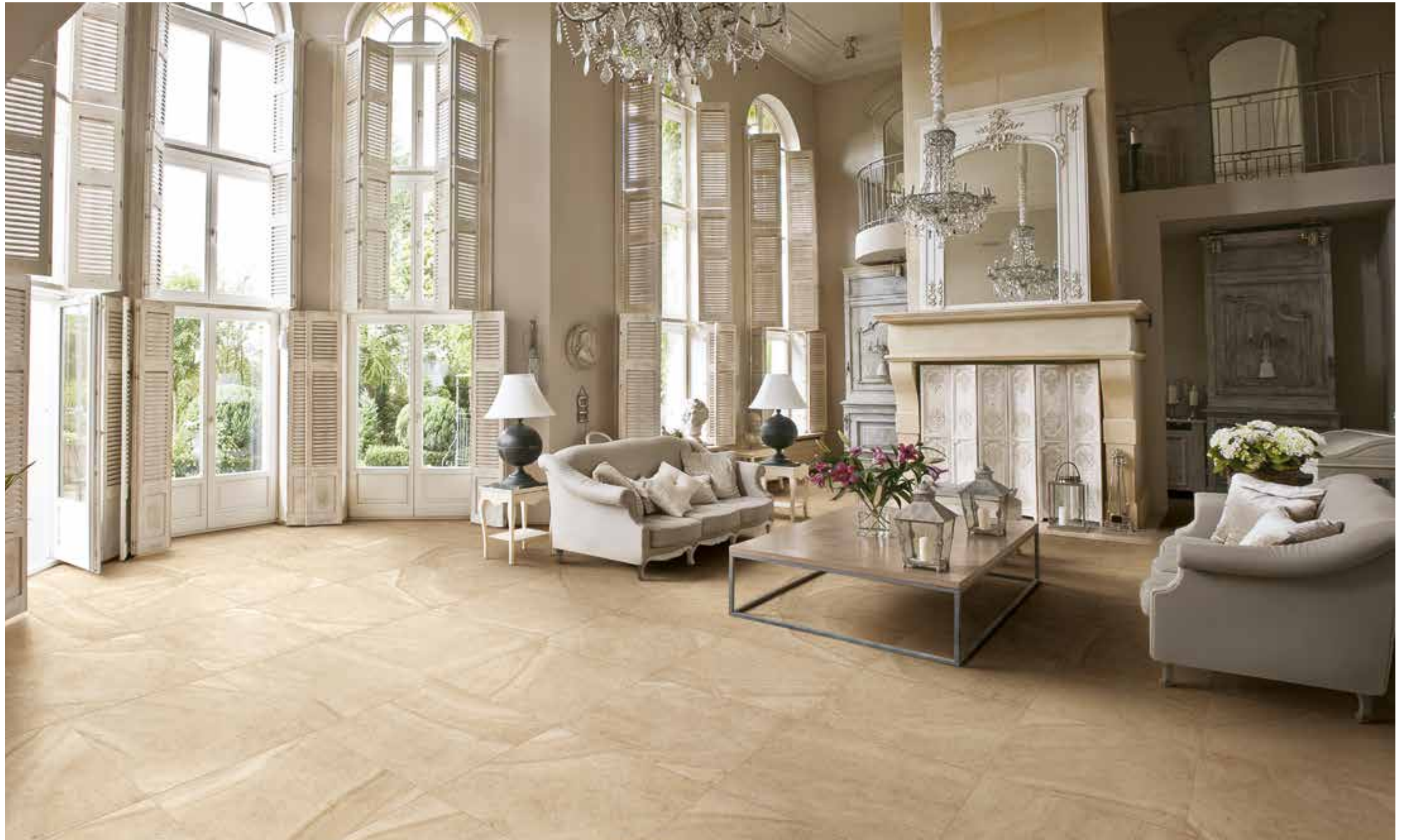
Maison Creme 60x60 cm