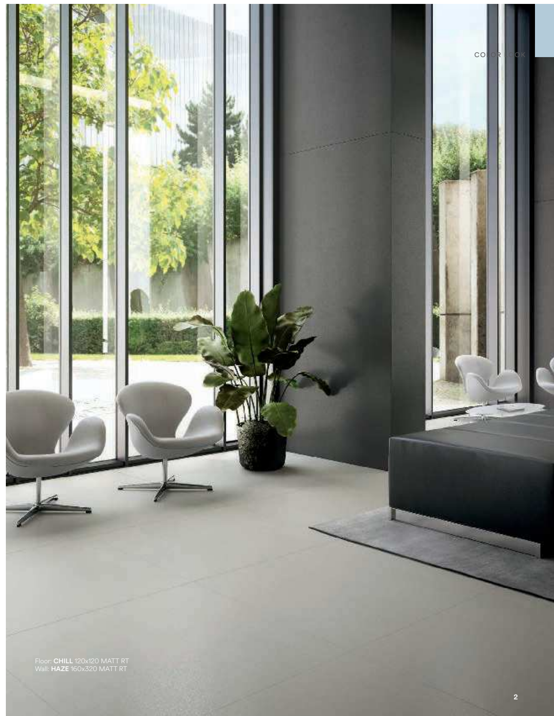
Floor: CHILL 120x120 MATT RT Wall: HAZE 160x320 MATT RT

Лаконичный стиль, универсальность и надежность для наивысшей эффективности самых амбициозных дизайнерских проектов. Нейтральные цвета и гибкий ассортимент поверхностей и форматов.